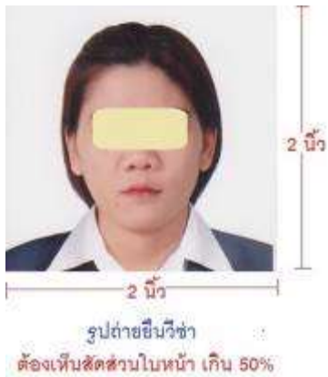
ตัวอย่างรูปถ่ายเพื่อยื่นขอวีซ่า U.S.A.

หนังสือเดินทางของท่าน จะถูกส่งคืนมาที่บ้านท่านทางไปรษณีย์ ตามที่อยู่ที่ยกรอกในแบบฟอร์มไว้